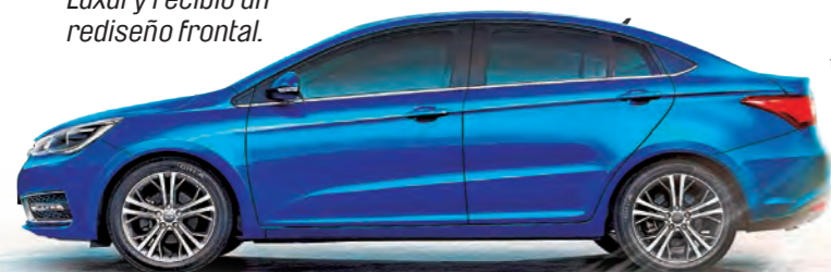
Elegancia y exclusividad es lo que ofrece el Arrizo 5.