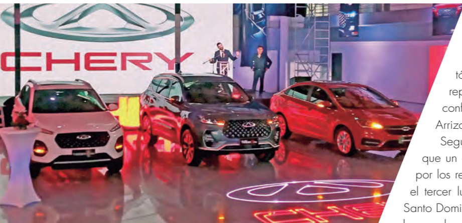
Con Chery Night, la marca celebró los buenos resultados obtenidos en el transcurso del 2021.