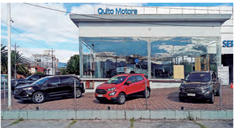
Los SUV configuran el segmento de mayor crecimiento en el país. Todas las marcas ofertan vehículos de ese tipo.

Los datos del año anterior dan cuenta de que durante octubre, noviembre y diciembre se vendieron 9.224, 9.941 y 9.550 unidades, respectivamente. Con ese antecedente, si se considera que en octubre del 2021 se vendieron 10.187 unidades y se proyecta que en noviembre y diciembre se venderán alrededor de 10.000 cada mes, al final del año el mercado bordeará las 120.000 unidades.