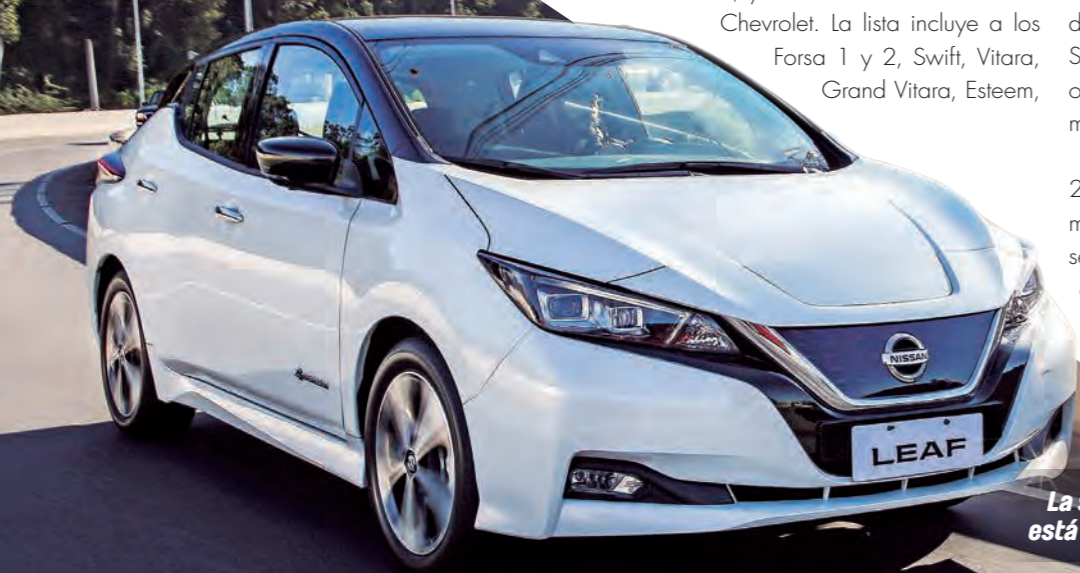
La segunda generación del Nissan LEAF está disponible en el país desde este año.

Los híbridos, por su parte, colocaron 2.494 unidades que equivalen al 2,9% del mercado. Estas cifras podrían incrementarse considerablemente y en un lapso breve, dada la tendencia de la industria hacia la microhibridación de mecánicas convencionales para mejorar la eficiencia y reducir las emisiones.