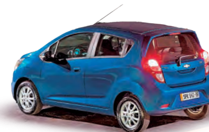
CHEVROLET SPARK GT