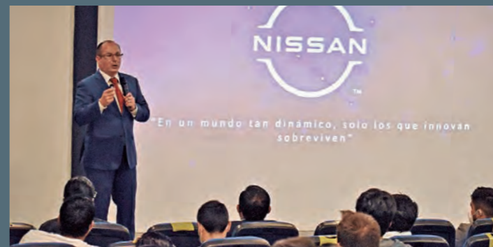
El Nissan LEAF puso en escena sus beneficios en el encuentro.

Los asistentes pudieron conducir el vehículo y probar por sí mismos su contundente entrega de torque y potencia, así como su funcionamiento silencioso. Además, pudieron conocer su generoso equipamiento en materia de seguridad, enmarcado en la visión Nissan Intelligent