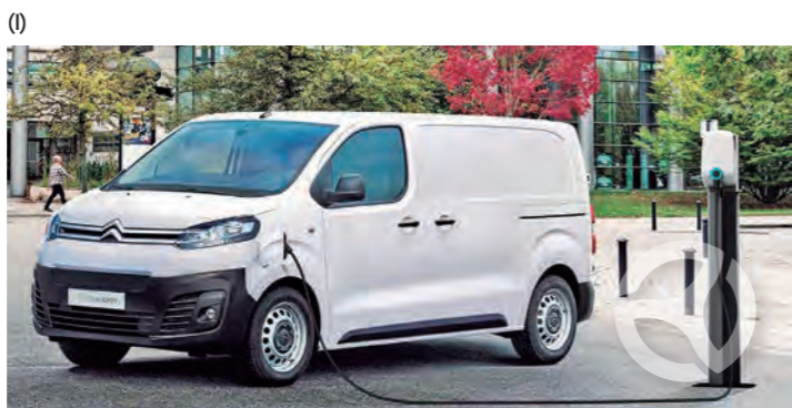
La marca planea electrificar vehículos de pasajeros y comerciales.

El portafolio global de la marca será cuidadosamente estudiado para evaluar su conexión con la región y con cada uno de sus mercados. De esa manera, el fabricante francés también será capaz de ofrecer