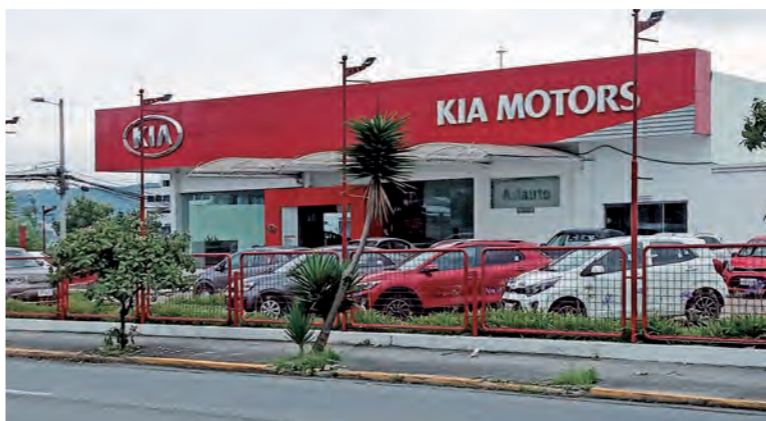
KIA se consolida como la segunda marca del mercado nacional: se acerca a la primera y se aleja de la tercera.

Respecto de las marcas más vendidas del país, Chevrolet se mantiene a la cabeza con algo más del 20% de participa-