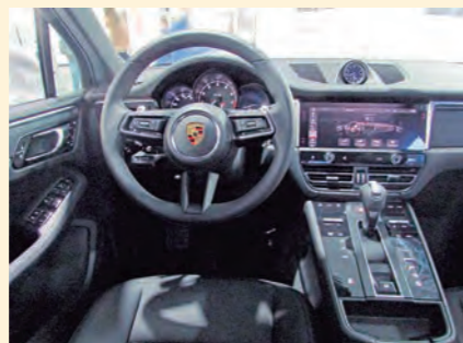
El cambio más notorio es interno, con el reemplazo de los mandos físicos por digitales.

El Porsche Macan, versión de entrada a la gama, recibe el impulso de un motor turboalimentado de cuatro cilindros y 1.984 cm 3 , que entrega 265 caballos de potencia entre