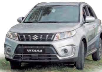
Vitara, ícono de Suzuki autos Ecuador.