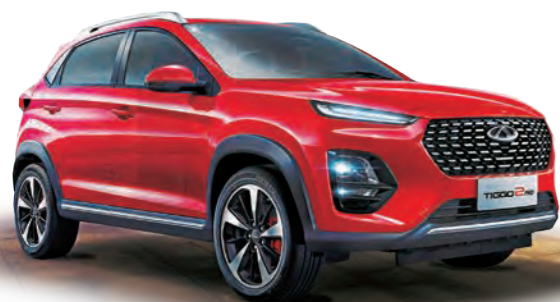
El Tiggo 2 Pro Luxury recibió un rediseño frontal.