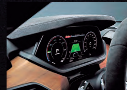
El del 'Volante de Oro' es uno más de los reconocimientos logrados por el Audi e-tron GT en el transcurso del último año.

Eso significa que es un premio otorgado por el público y, por lo tanto, una elección sincera para un automóvil emocional.