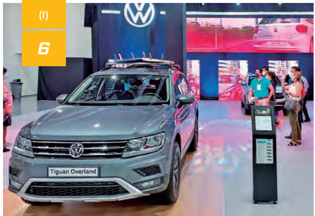
En el mes de septiembre, el 'Autoshow Guayaquil 2021' contribuyó a reactivar al sector automotor en el Puerto Principal.