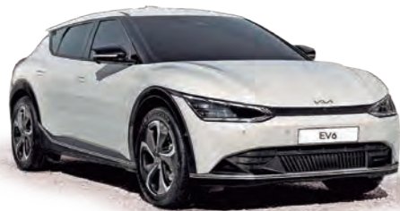
KIA EV6: el eléctrico de rango extendido.