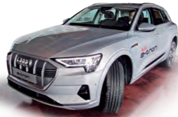
Audi e-tron: el eléctrico de alta gama.

A pesar de las adversidades, el 2021 ha permitido que el sector automotor logre una importante recuperación y ha dado espacio para la introducción de nuevos modelos, nuevas tecnologías e incluso de nuevas marcas, cuyas propuestas brindan más opciones a los usuarios.