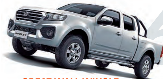
GREAT WALL WINGLE

Por el amplio margen de ventaja que ostenta sobre el segundo modelo de la lista, resulta bastante improbable que la D-Max pudiera perder su liderato en los dos meses que faltan para el cierre del año. No obstante, la estrecha diferencia que existe entre el segundo y el sexto clasificados hasta octubre (menos de 400 unidades) podría hacer que las posiciones entre ellos varíen.