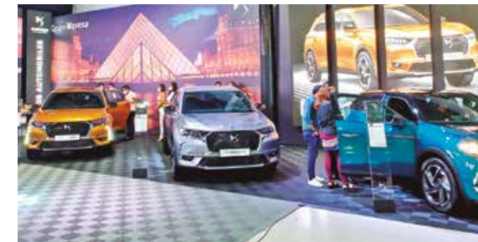
El Centro de Convenciones recibió una gran cantidad de visitantes durante los días que duró la feria.