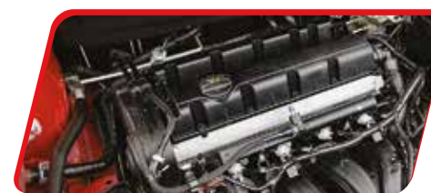
Motor 2.0L de 145 HP

ELIGE UN SUV POTENTE, GRANDE Y CON LA IMPONENTE PRESENCIA QUE TE DESTACA DONDE SEA.