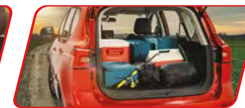
Cajuela con capacidad de 370 L