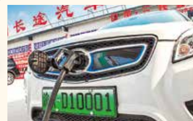
SUV, deportivos, eléctricos... La oferta china abarca todos los segmentos.